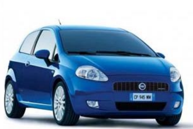
FIAT Grande Punto