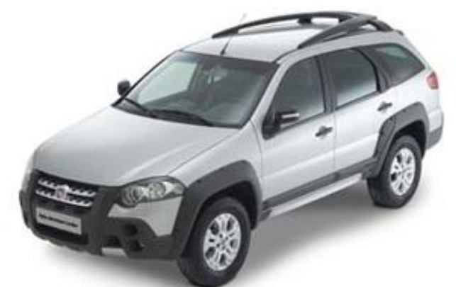
FIAT Palio Weekend