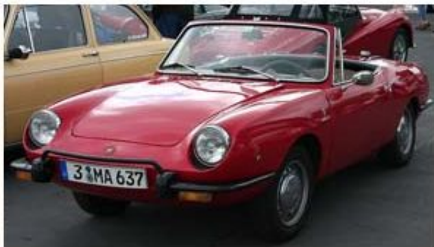
FIAT 850 SPIDER