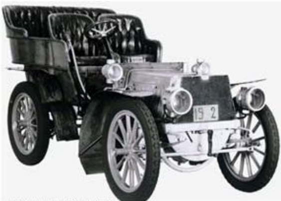
FIAT 24HP CORSA